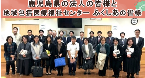
鹿児島県の法人の皆様と地域包括医療福祉センター ふくしあの皆様

本郷拠点「わが家ひだまり」の施設を見学された後、法人のご説明をさせていただきました。