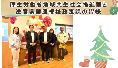
厚生労働省地域共生社会推進室と滋賀県健康福祉政策課の皆様

主に就労に関する視察で、「働きがいと働きやすさ」の実践や外国籍職員雇用と育成などの取り組みを中心にご紹介させていただきました。