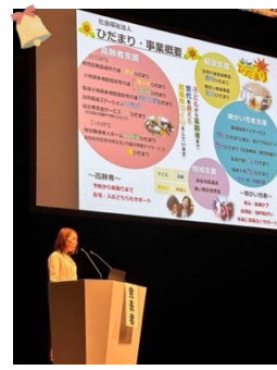
この日の登壇でご一緒した皆様