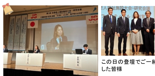
この日の登壇でご一緒した皆様

11月6日に「全国介護事業者連盟 全国大会 in 東京2024」が開催され、「持続可能な介護保険制度と経営改革」をテーマに講演いたしました。主にひだまりでの実践報告を発表させていただきました。