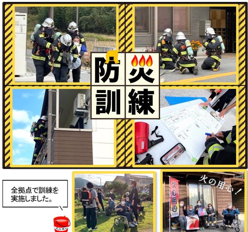
全拠点で訓練を実施しました。

訓練の準備から当日の実施までご協力いただきました湖北地域消防本部米原署の皆様、心より感謝申し上げます。今回の訓練を通じて得られた貴重な経験を活かし、今後も安心・安全な施設運営に努めてまいります。