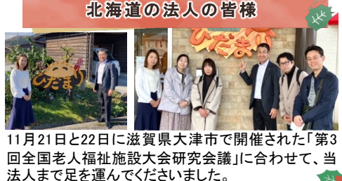
北海道の法人の皆様

11月21日と22日に滋賀県大津市で開催された「第3回全国老人福祉施設大会研究会」に合せて、当法人まで足を運んでくださいました。